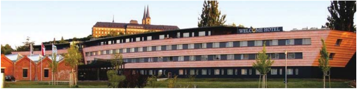
Welcome Kongresshotel Bamberg

Die Welt steht derzeit vor wahrhaft globalen Herausforderungen. Die ökologischen Wandlungen mit nicht abzusehenden Folgen, die Suche nach neuen Energiequellen und ein schier unbegrenztes Wachstum der Erdbevölkerung erfordern auf allen Gebieten die Bereitschaft, neue Wege zu gehen.