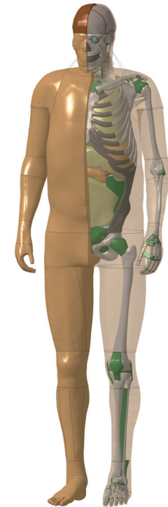
THUMS™, entwickelt von Toyota Motor Corporation und Toyota Central R&D Labs